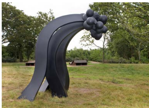
Rui Chafes, I am your yesterday – and you are my tomorrow, 2010, Esbjerg.