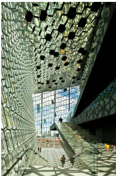
Olafur Eliasson, Facades of Harpa Reykjavik Concert Hall and Conference Centre, 2005-11, Reykjavik, Island.