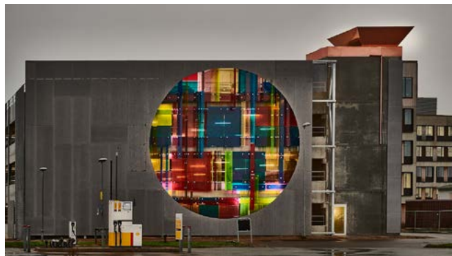
Kirstine Roepstorff, HYDRA, 2020, P-hus i Kanalbyen, Fredericia.