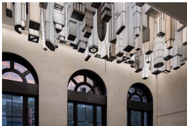
Elmgreen & Dragset, The Hive (2020).