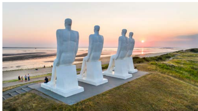
Svend Wiig Hansen, Mennesket ved Havet, 1995, Esbjerg.